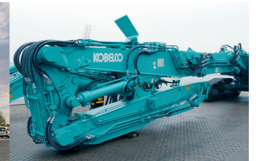
Kobelco SK400D Langarm