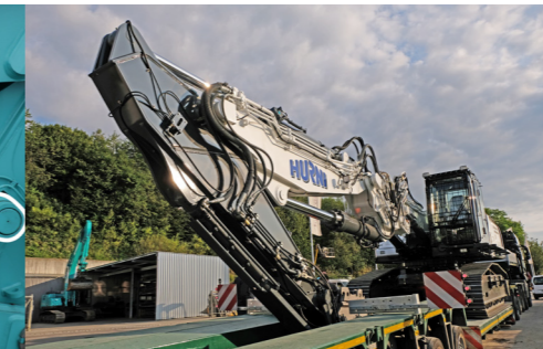
Kobelco SK400D Kurzarm