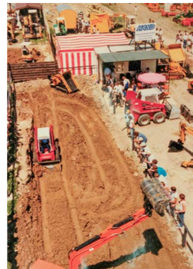
Hand Spezialmaschinen, Öga 1978, 031 888 00 96