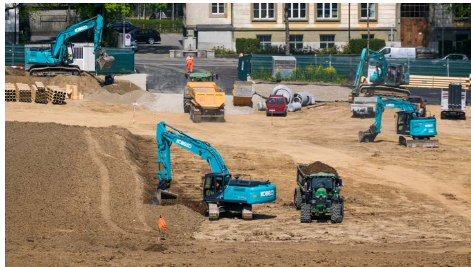
Bern, Viererfeld, vier Kobelcos auf einer Baustelle (Bau Containerdorf durch Ecoterra AG)